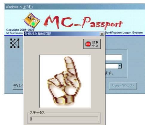
指紋認証プラグイン FAP 操作画面